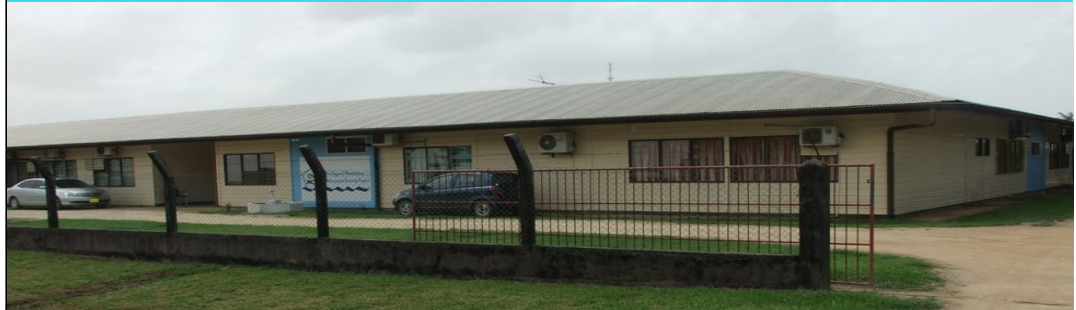
Foto : Het gebouw van het Overliggend Waterschap MCP