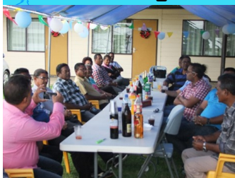
Foto: Personeelsleden OW MCP tijdens de oudejaarsviering