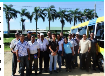
Foto: Personeel OWMCP tijdens een bedrijfsbezoek aan Staatsolie