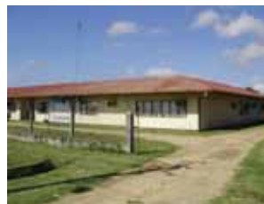
Het Overliggend Waterschap MCP, opgericht per staatsbesluit no 75 d.d. 14 juni 2007 is qua activiteiten in een

Een succesvolle transformatie begint bij goede communicatie, voldoende informatie en optimale participatie van alle stakeholders. Als aanzet is deze nieuwsbrief tot stand gekomen om de wederzijdse contacten op gang te brengen met het doel om van elkaars ervaringen, kennis en kunde te leren.